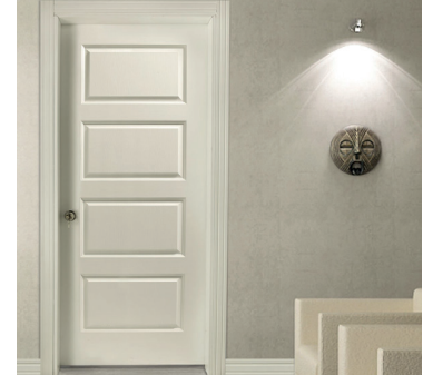
Option Mill (MO)

Pour une utilisation régulière (intérieur seulement)